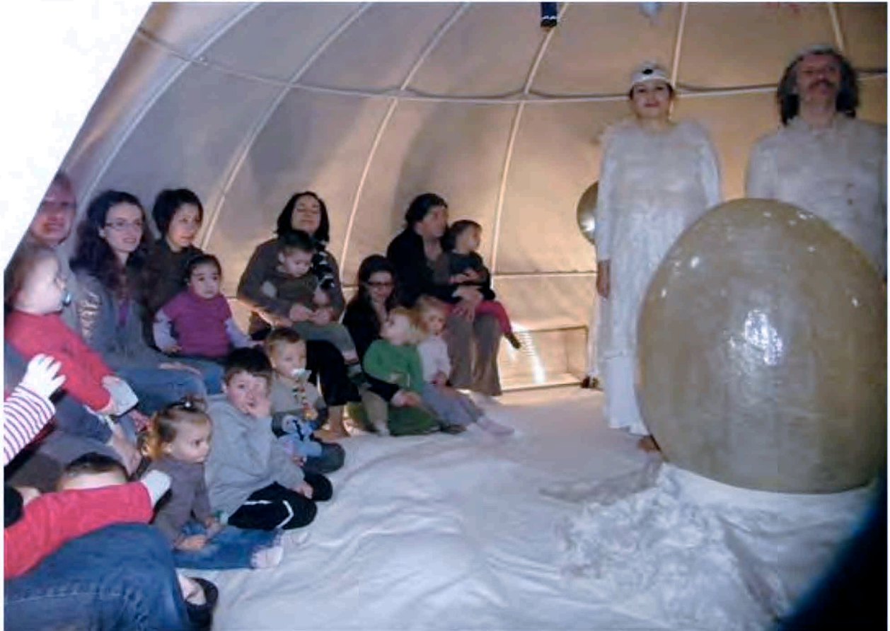
Ploùm le pingouin va bientôt sortir de son œuf.

Dans le cadre des journées petite enfance, les très jeunes enfants étaient conviés à un spectacle magique et mystérieux sous un igloo. Trois séances dans la journée, 9 h, 10 h 30 et 15 h ont transporté les bambins et les parents dans un monde irréel et intrigant.