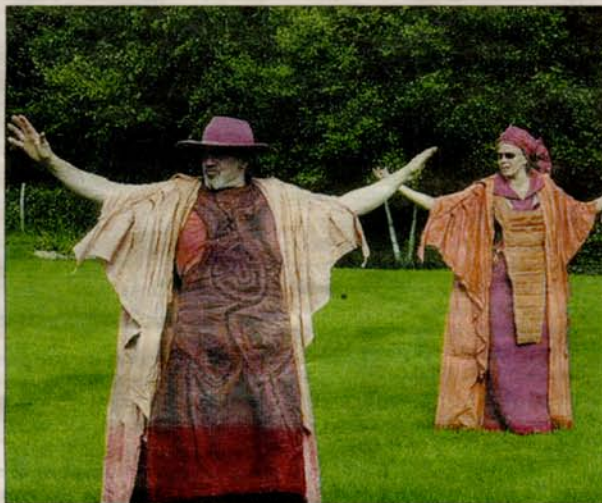
ÉCOLOGIE. La Compagnie des Champs jouera l'une de ses dernières créations, Mission biodiversité , demain soir.