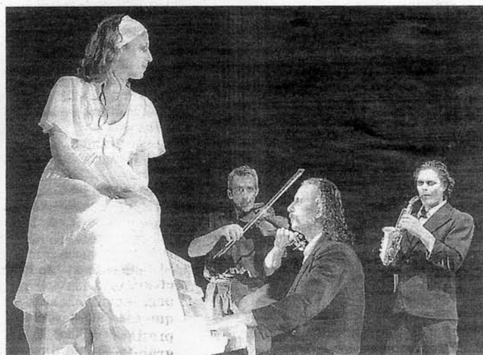
Qu'est-ce qu'elles ont, leur gueule ?

Au Mobile Homme Théâtre, vendredi 26 et samedi 27 janvier à 20h30